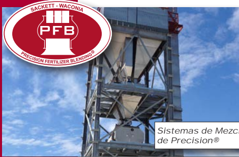
Sistemas de Mezclado de Precision®