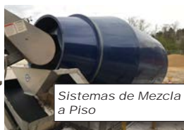
Sistemas de Mezcla a Piso