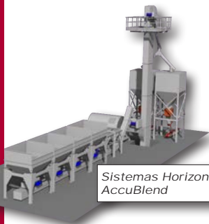
Sistemas Horizontales AccuBlend