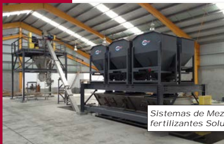
Sistemas de Mezcla de fertilizantes Solubles