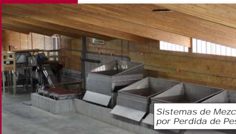
Sistemas de Mezclado por Perdida de Peso